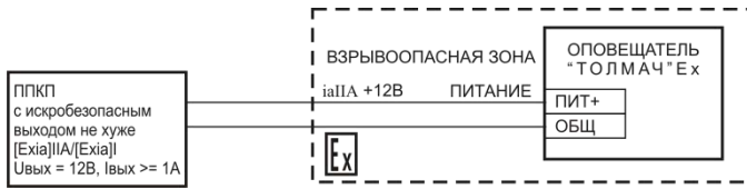
Рис.1 Подключение оповещателя «Толмач» Ех к искробезопасным выходам ППКП.

Взрывобезопасное исполнение оповещателя «Толмач» Ех подключается к искробезопасным электрическим цепям по ГОСТ 30852.10 с искробезопасными параметрами (уровень искробезопасной электрической цепи и подгруппа электрооборудования) соответствующими условиям применения оповещателя «Толмач»Ех во взрывоопасной зоне (рис.1).