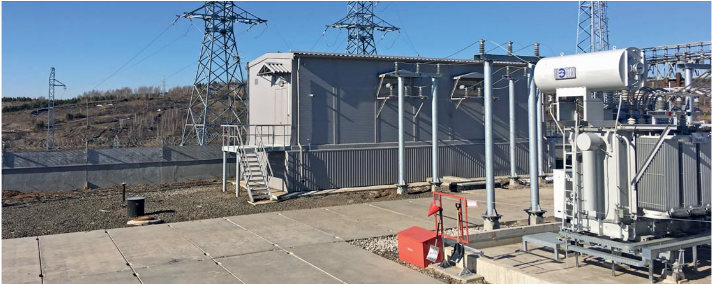
Кемеровская область. Подстанция «Сычёвская». Контроль перегрева кабелей.

тров друг от друга, поэтому нужно разметить место их установки. Если крепление проводится к потолку, то нужно просверлить 2-4 отверстия в потолке, забить дюбели;