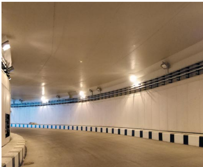
Московская область. Калужский разворотный тоннель. Три линии ЧЭ ИПТЛ «ЕЛАНЬ». Сколько бы здесь потребова- лось точечных тепловых извещателей?

При использовании специального оптического волокна ЧЭ можно использовать в гермозонах атомных электростанций (АЭС) и на других объектах с присутствием радиации.