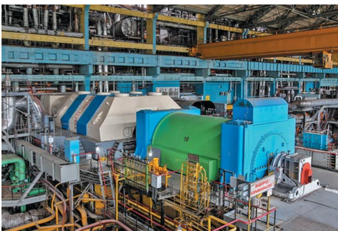
Свердловская область. Среднеуральская ГРЭС.

Как видно, ЧЭ ИПТЛ будет установлен гораздо быстрее, чем ИПТТ и с меньшими затратами.