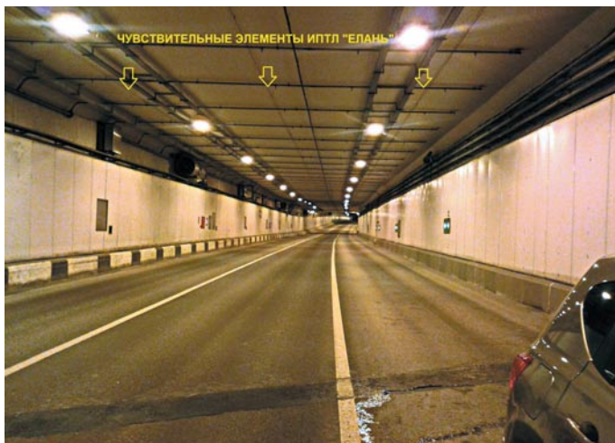
Москва. Алабяно-Балтийский автомобильный тоннель. Подвес оптоволоконного Чувствительного Элемента (ЧЭ) над дорогой.